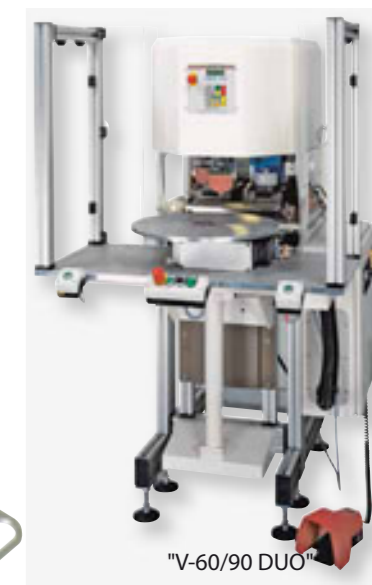
"V-60/90 DUO" s rotačním stolem